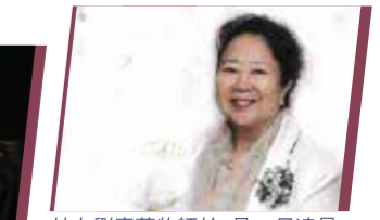
校友劉惠蓮牧師於1月22日凌晨3:59息勞歸主，安息禮拜已於2月20日舉行，願主安慰劉牧師家人。