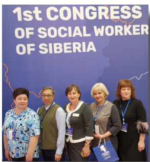
西伯利亞第一屆社會工作者研討會

但神的能力夠用；尤其見到學員的熱誠學習態度，並且在研討會後的正面的回應，實在給我很大的鼓勵和感動。雖然我們沒有機會直接談及信仰，但從他們對服務群體的付出和擺上，我相信，基督的愛已在他們的心裡，實在為此感恩。