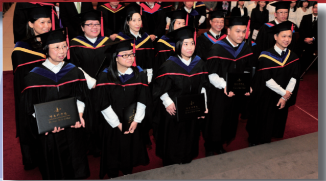
12位畢業生領受差遣