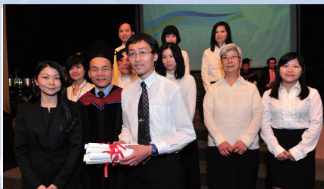
教會領袖神學證書課程畢業生 (神召會禮拜堂)