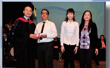
教會領袖神學證書課程畢業生 (國際神召會)