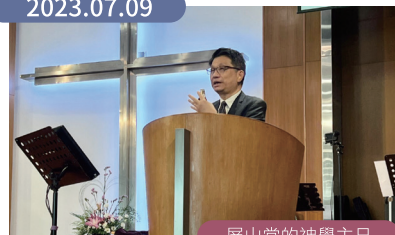
屏山堂的神學主日