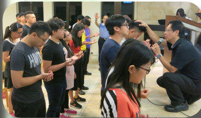
1. 2016 年開學營已於 8 月 29 至 31 日舉行。