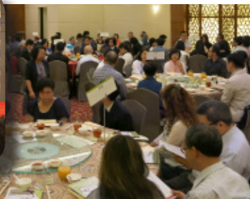
2. 神召神學院夥伴同行異象分享餐會已於 2016 年 10 月 25 日舉行。