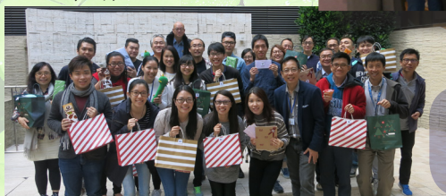
5. 2016 年師生聖誕聯歡會已於 12 月 15 日舉行。