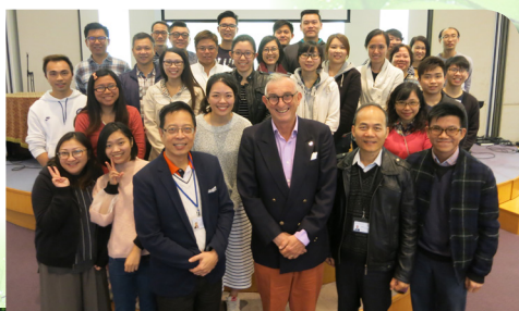
4. 於 12 月 2 日舉行 12 月月會，邀得 The Vine Church 的 Rev. John Snelgrove 分享香港的城市宣教及植堂策略。